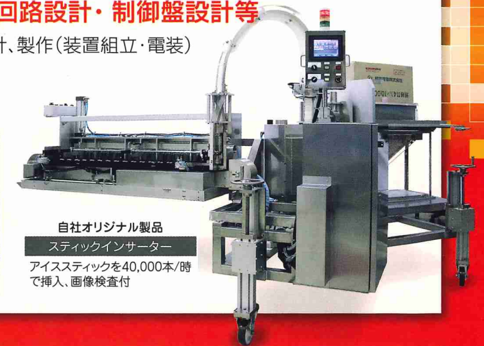
自社オリジナル製品 スティックインサーター アイススティックを40,000本/時 で挿入、画像検査付